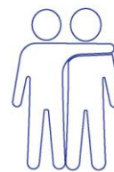
Vermeiden Sie engen Kontakt Bei jedem, der Symptome einer Atemwegserkrankung aufweist.