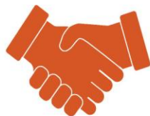
Durch direkten Kontakt Übertragung von Mensch zu Mensch