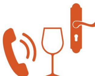
Berührung Kontaminierte Gegenstände oder Oberflächen