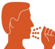
Durch Tröpfchen Wenn infizierte Personen, husten, niesen oder sprechen