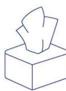
Bedecken Sie Mund und Nase Mund und Nase beim Husten, Niesen oder Kochen mit Taschentuch bedecken