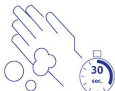
Häufiges Händewaschen Händewaschen mit Seife für mind. 30 Sekunden.